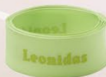
Easter Green NEW