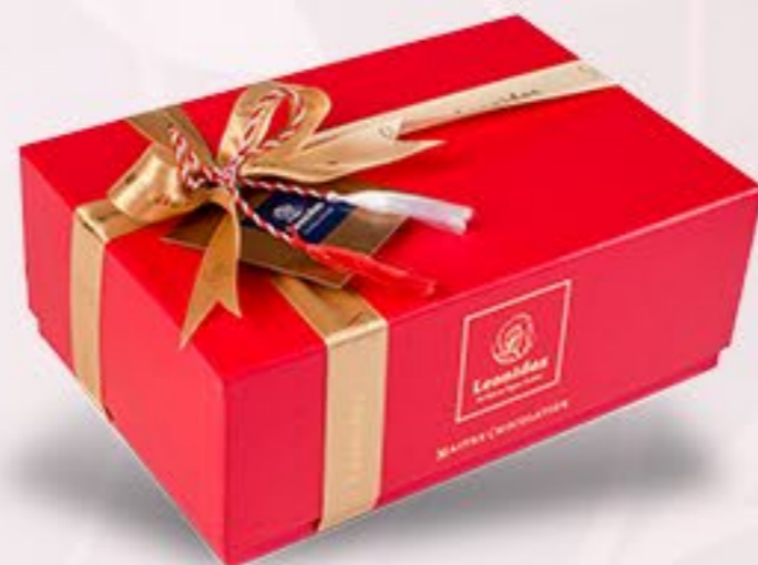
Bijoux & Love