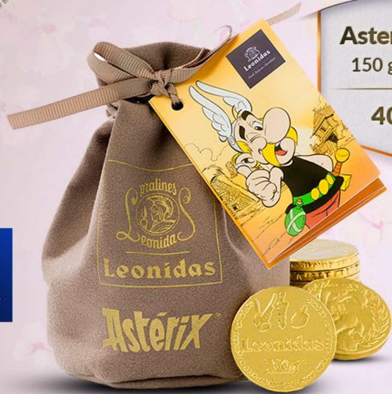
Asterix Bag 150 g bănuți 40 lei