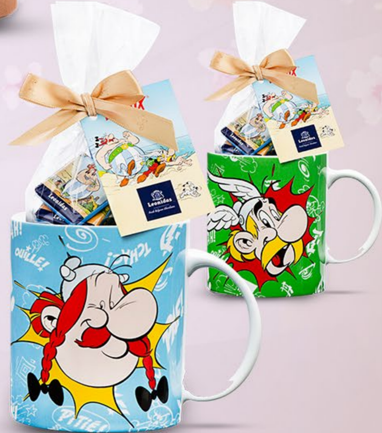
Asterix Cană 150 g mini tablete 60 lei